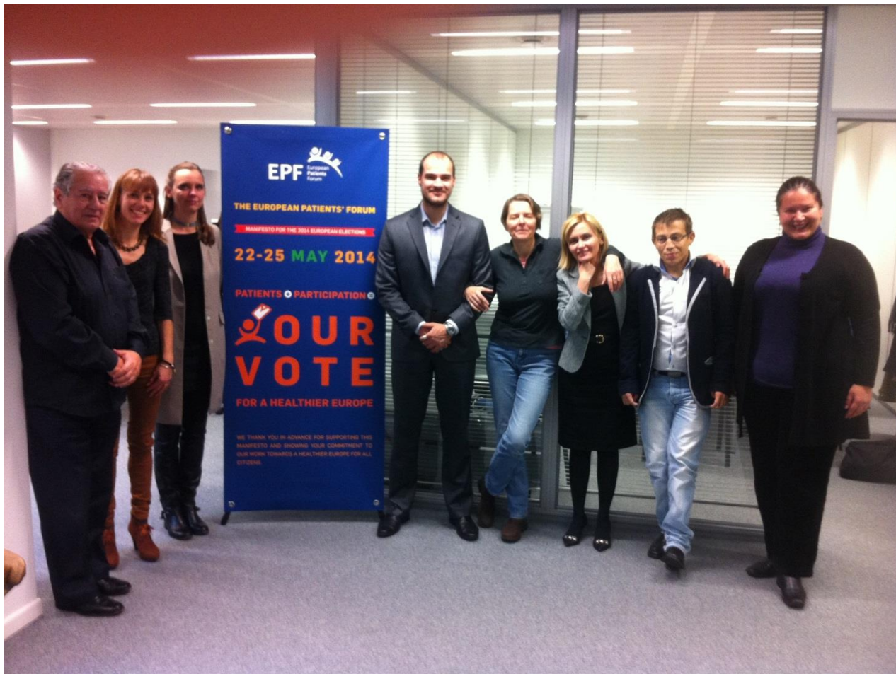
Consensus Meeting, Access and Equity for Patients