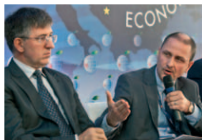
Koszty pośrednie w ochronie zdrowia. Prezentacja raportu i rekomendacje dla Polski