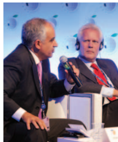
Joao Carvalho das Neves, Prezes Centralnej Administracji Systemu Opieki Zdrowotnej, Portugalia Jesper Fisker, Sekretarz Stanu w Ministerstwie Spraw Wewnętrznych i Zdrowia, Dania

Forum Ochrony Zdrowia, które już po raz 5 odbędzie się w trakcie Forum Ekonomicznego, przypada w roku w którym obchodzimy 25. rocznicę transformacji ustrojowej, 15-lecie funkcjonowania rynku usług medycznych w Polsce oraz 10. rocznicę przystąpienia Polski do Unii Europejskiej. Na tle tych wydarzeń warto się zastanowić, jaka jest przyszłość systemu opieki zdrowotnej w Polsce, biorąc pod uwagę doświadczenia innych krajów. Dyskusje podczas Forum Ochrony Zdrowia to doskonały moment nie tylko na podsumowanie dotychczasowych osiągnięć, ale także na zastanowienie się nad nowymi systemowymi rozwiązaniami problemów wynikających ze zmian demograficznych i cywilizacyjnych, przed którymi stoi Polska i państwa Unii Europejskiej.