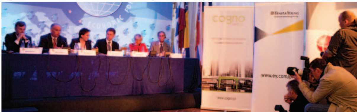
Rola i miejsce regulatora w systemie Ochrony Zdrowia