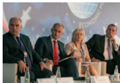
Koordynowana opieka zdrowotna - doświadczenia międzynarodowe, propozycje dla Polski

Goście debaty poświęconej polityce lekowej państwa za najważniejsze problemy w perspektywie długoterminowej uznali zmniejszenie nierówności w dostępie do ochrony zdrowia oraz zwiększenie dostępu do innowacji. Nawiązywali w ten sposób do tez brytyjskiego epidemiologa profesora Richarda Wilkina, autora „Ducha równości”, który był gościem specjalnym Forum Ochrony Zdrowia.